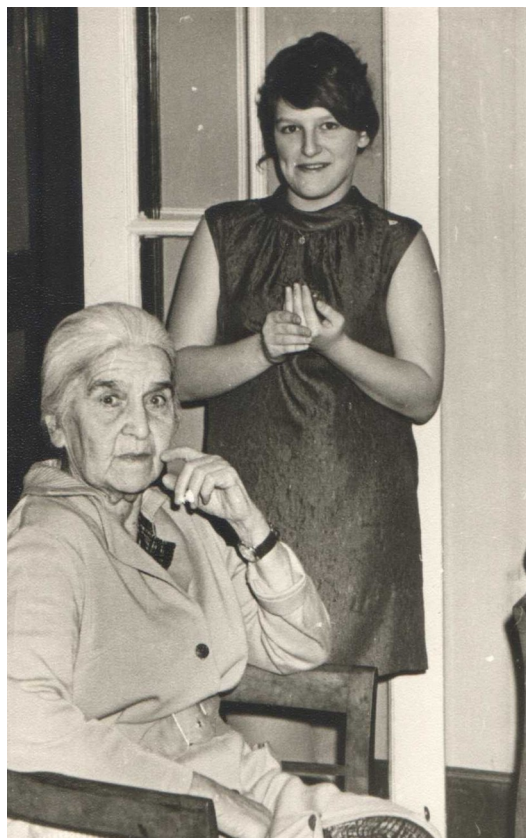
Я с бабушкой. 1 января 1970 года